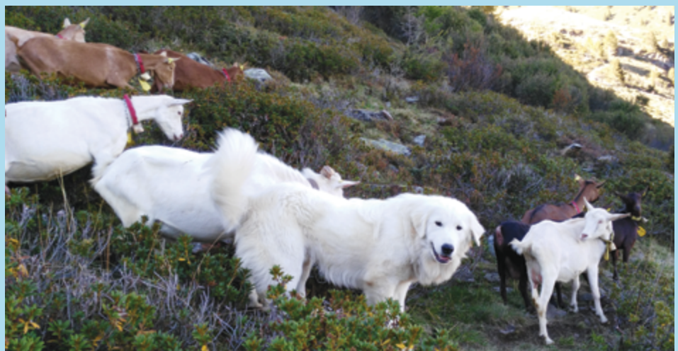
Maremma Abruzzese auf der Weide.