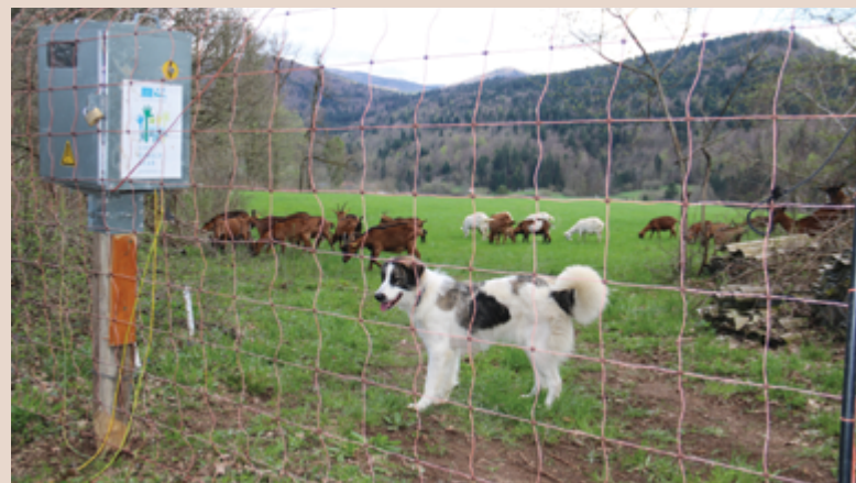
Das Weglaufen von der Weide wird durch einen ausreichend hohen Elektrozaun verhindert, der ständig unter Spannung steht.

Wir müssen sicherstellen, dass das Weglaufen nicht zur Gewohnheit wird. Es sollte ein Elektrozaun installiert werden, der aufgrund der Angst vor Schmerzen (Kontakt mit Elektrizität) nicht nur ein körperliches, sondern hauptsächlich ein psychologisches Hindernis darstellt. Wir sollten einen jungen Hund so schnell wie möglich mit dem Elektrozaun vertraut machen und nicht zu viel mit ihm spielen, damit er nicht zu sehr an uns hängt.