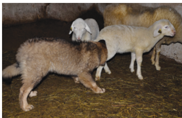
Junger Karst-Schäferhund, der sich beim Schnuppern mit dem Lamm vertraut macht.