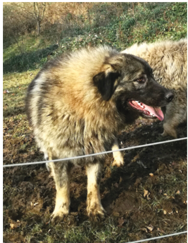
Es wird empfohlen, einen Welpen aus einer Arbeitslinie auszuwählen.

Ein erfahrener Züchter von Herdenschutzhunden erkennt die ersten Anzeichen, ob das Jungtier geeignet ist, als Herdenschutzhund zu arbeiten, und kann den Interessenten bei der Auswahl des Jungtiers beraten.