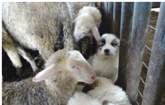
Es ist wichtig, dass die Welpen bereits im Alter von acht Wochen die Herde kennen lernen.