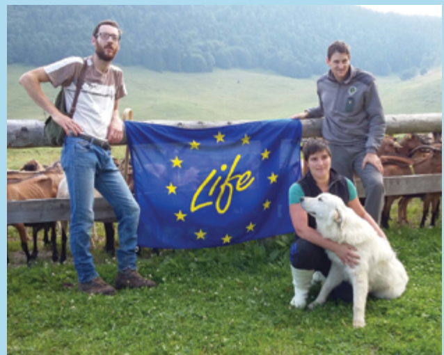
Einer der Hunde der Autonomen Provinz Trient (Italien).

Im Rahmen des Projekts LIFE DINALP BEAR wurden in der italienischen Provinz Trient 36 Herdenschutzhunde der Rasse Maremmano Abruzzese verteilt, um Schaf- und Ziegenherden zu schützen. Die Herkunft der Hunde wird vom Verband der Züchter der Maremmano Abruzzese bestätigt. Auf dem Feld arbeitet die Provinz Trient regelmäßig mit den Empfängern der Hunde zusammen und kontrolliert durch die Überwachung der Hunde die Aufnahme der Welpen in die neue Umgebung. Ihr Ziel ist es, den Hunden eine geeignete Umgebung zu bieten, in der sie die angeborenen Merkmale in Kombination mit angemessenem Training entwickeln können. Die Hunde werden daher regelmäßig von einem Tierarzt besucht, der in der Zucht von Herdenschutzhunden ausgebildet ist. Der Tierarzt überprüft den Gesundheitszustand der Hunde und berät die Besitzer bei den wichtigsten Schritten zur Ausbildung eines effizienten Herdenschutzes.