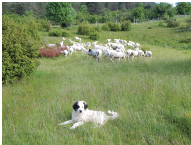
Herdenschutzhunde verbringen ihr Leben in der Nähe der Herde.