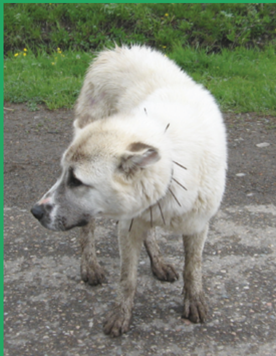
Ein Halsband mit scharfen Stacheln schützt den Hund vor Bissen in den Hals.

Wenn ein Mutterschaf ein Lamm hat, fressen die Herdenschutzhunde die Plazenta-Reste, was die Herde vor Raubtieren schützt. Ein solches Verhalten ist völlig normal und hat keinen Einfluss auf die Einstellung des Hundes gegenüber den Tieren in der Herde.