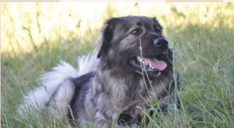
Der Karst-Schäferhund ist eine der häufigsten Rassen der Herdenschutzhunde in Slowenien und eine in Slowenien heimische Rasse.

Folgen von Tieren in der Herde im Bereich der Herde bleiben Beschnuppern von Tieren in der Herde unterwürfiges Verhalten Bellen bei ungewöhnlichen Ereignissen