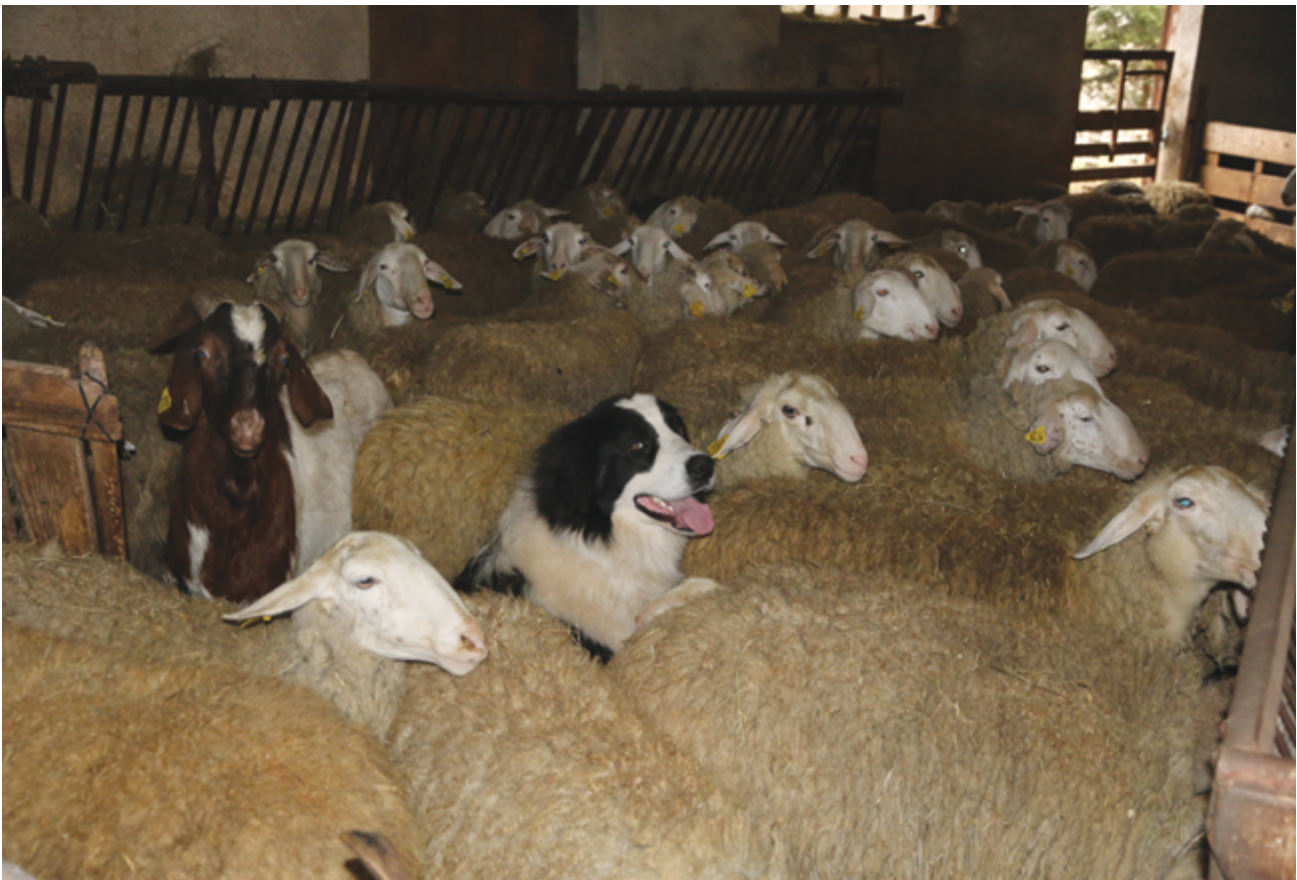
Herdenschutzhunde verbringen ihre Zeit mit der Herde, auch im Winter, wenn die Tiere in einem Stall gehalten werden.

können. Trotzdem bleibt der Hund in engem Kontakt mit der Herde. Zu Beginn sollte der Hund in eine kleine Herde ruhiger und toleranter Tiere gestellt und regelmäßig beobachtet werden. Erwachsene Hunde müssen auch im Winter in ständigem Kontakt mit der Herde gehalten werden, damit sie den Kontakt zu ihr nicht verlieren.