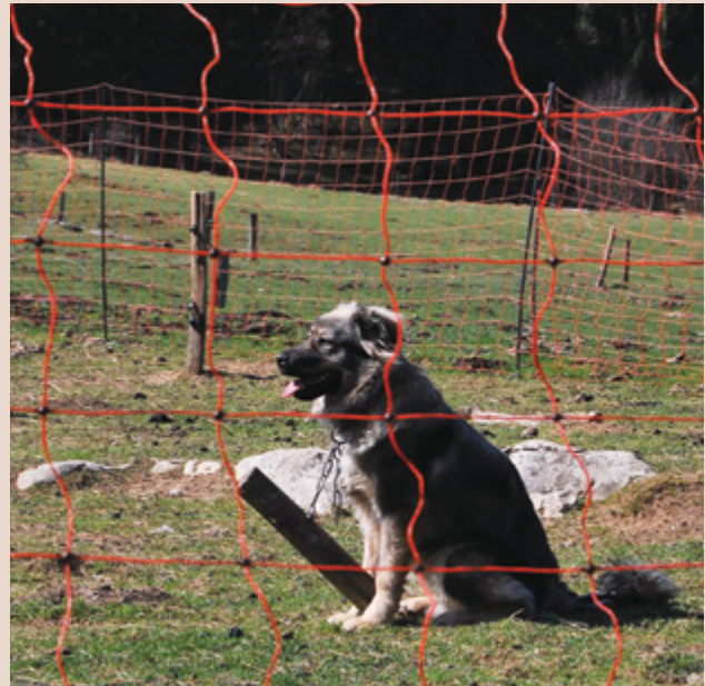
Ein junger Karst-Schäferhund mit einem Halsband mit einem daran hängenden Stöckchen, der den Hund beim Bewegen behindert.