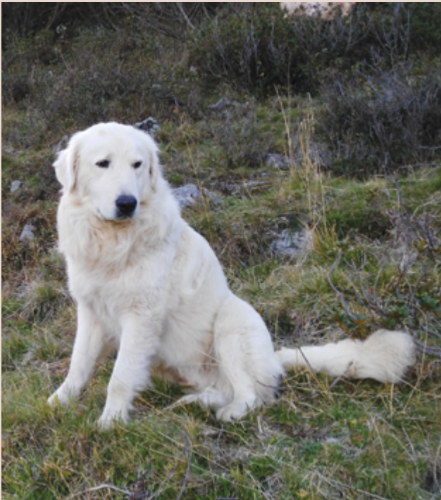
Maremano Abruzzese.