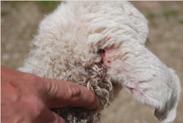
Beißen ist eine sichtbare Beschädigung der Ohren oder anderer freiliegender Teile.

Wie bei allen Arten von störendem Verhalten sollten wir sofort beim Beißen Maßnahmen ergreifen, da eine schnelle Reaktion von entscheidender Bedeutung ist. Durch das Beobachten erkennen wir die Anzeichen, die das Beißen vorhersagen, und verhindern dies, indem wir den Hund kurz davor warnen.