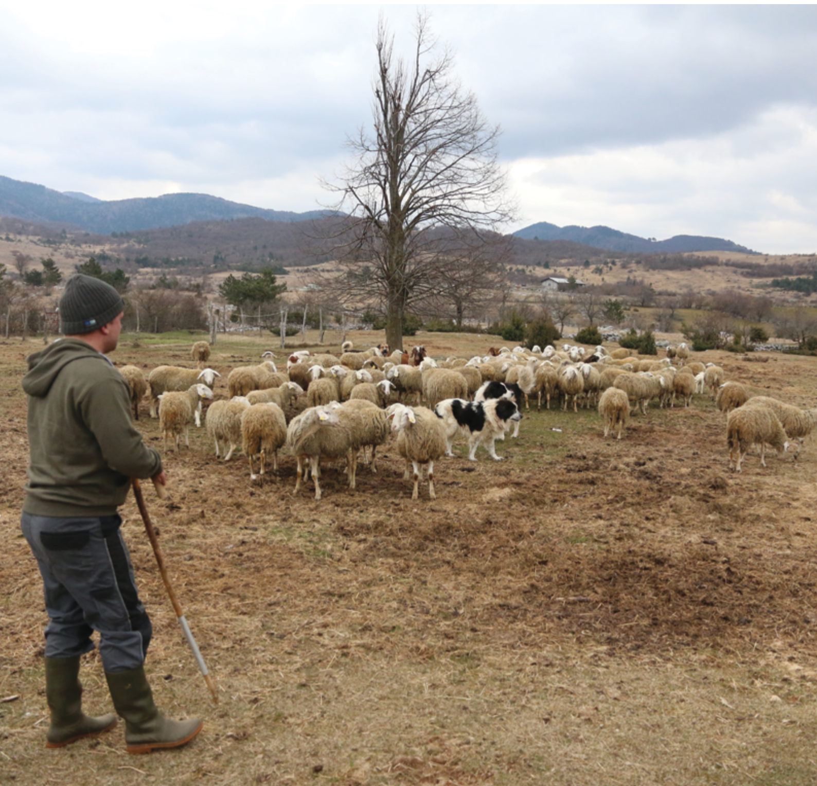
Eine erhöhte Anzahl von Hunden erhöht die Zuverlässigkeit beim Schutz vor Raubtieren.