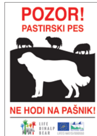
Warnschild mit Hinweis auf die Anwesenheit von Herdenschutzhunden auf der Weide. Design: Igor Pičulin

Unerwünschte Besuche auf der Weide können durch das Aufstellen von Warnschildern verhindert werden, die die Passanten über die Anwesenheit von Hunden informieren. Die Schilder sollten an allen möglichen Durchgängen und dicht genug am Weg angebracht werden, um von den Passanten nicht übersehen zu werden. Am Eingang der Weide sollte ein Schild mit den Angaben des Eigentümers (Vor- und Nachname, Adresse, Telefon) angebracht werden.