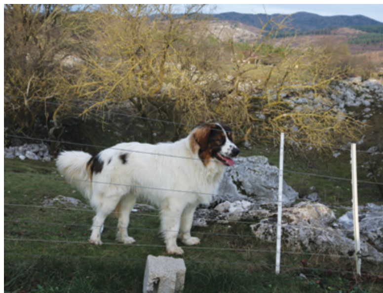
Elektrozaun verhindert das Entkommen von der Weide.

Ein Hund, der von der Weide wegläuft, kann mehrere Kilometer zurücklegen und ist wiederholt dem Verkehr ausgesetzt. Um dies zu verhindern, müssen wir sicherstellen, dass der Hund bei der Suche nach einem Ausgang niemals erfolgreich ist. Es hilft auch, wenn der Hund keinen Grund hat zu gehen, was viel schwieriger zu erreichen ist. Je früher ein junger Hund erkennt, dass das Hindernis nicht überwunden werden kann oder schmerzhaft ist (Elektrizität), desto wahrscheinlicher ist es, dass er die Grenze respektiert.