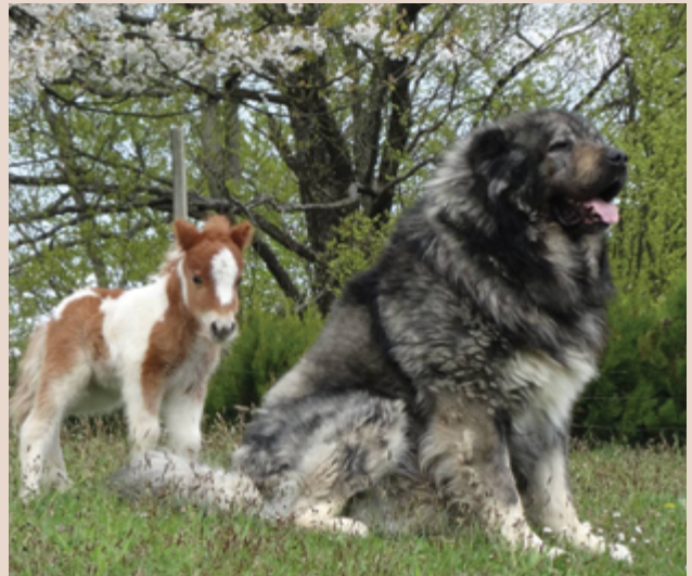
Kaukasischer Schäferhund.