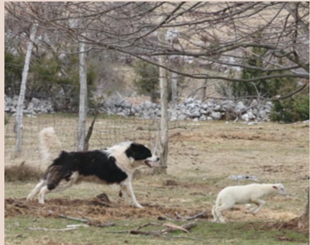
Ein junger Torjak jagt ein Lamm.