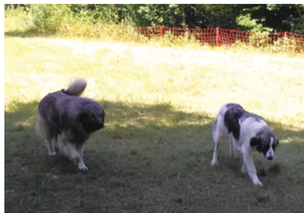
Erwachsener jugoslawischer Schäferhund oder Sharplaninac und anderthalb Jahre alter Tornjak.

Wenn die Herde von einem erwachsenen, bereits ausgebildeten Hund geschützt wird, muss der Welpen schrittweise aufgenommen werden, um ein Abwehrverhalten des vorhandenen Hundes zu verhindern. Die Ausbildung des jungen übernimmt dann der erwachsene Hund durch das Vorführen des richtigen Verhaltens. Der Erwachsene wird auch den Jungen beruhigen und das Auftreten von störendem Verhalten verhindern. Wenn wir erst begonnen haben, die Herde mit Herdenschutzhunden zu schützen, müssen junge Hunde einzeln und nacheinander in die Herde aufgenommen werden. Andernfalls kann die Verspieltheit mehrerer Welpen gleichzeitig dazu führen, dass sie sich nicht an die Herde binden.