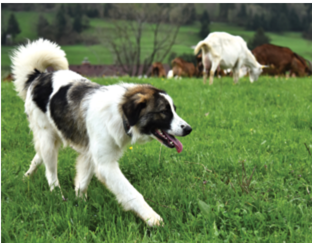
Besonderes Augenmerk wird auf die Beobachtung des Hundes gelegt, wenn er das erste Mal mit der Herde auf die Weide gebracht wird.

Von den ersten Wochen bis zum Alter von anderthalb Jahren wird der Hund regelmäßig und häufig kontrolliert, was sowohl heimlich als auch direkt in der Herde geschieht. So kann festgestellt werden, ob und wann wir dem Hund vertrauen können. Regelmäßige Beaufsichtigung und häufige Anwesenheit bieten auch die Möglichkeit auf die Beseitigung störender Verhaltensmuster, die sich zu schlechten Gewohnheiten entwickeln könnten. Die Beseitigung von ungewünschtem Verhalten muss daher rechtzeitig, effektiv und konsequent sein. Mehr dazu in Kapitel 7.