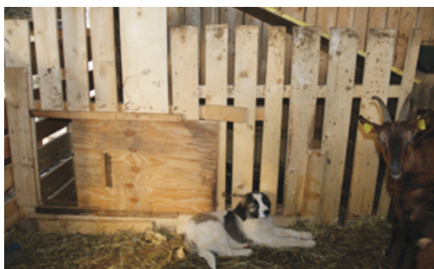
Ein junger Hund muss sich vor den Tieren in der Herde zurückziehen können.