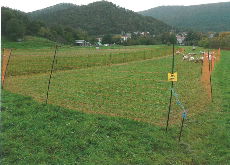
Z visokimi elektromrežami učinkovito zaščitimo premoženje pred napadom medveda

je Slovenija, nujno. S tem se vzdržujejo lokalne gostote medvedje populacije na ravneh, ki so še sprejemljive za ljudi, ki živijo na območjih prisotnosti medveda. Število medvedov za odstrel vsako leto predlaga Zavod za gozdove Slovenije, točno število določi pristojno ministrstvo, odlok o odstrelu izda Vlada RS, načrtovan odstrel pa nato izvedejo upravljavci lovišč, torej lovske družine in lovišča s posebnim namenom.