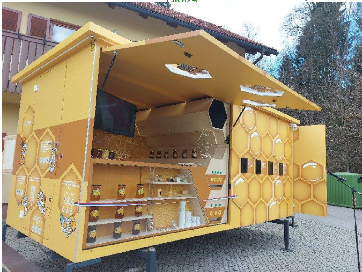
Paviljon Medena zgodba, Foto: ČZS