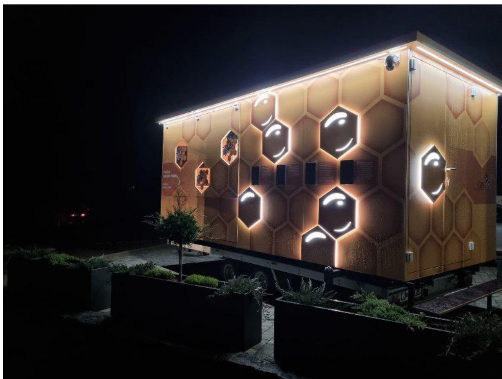
Paviljon Medena zgodba ponoči, Foto: ČZS