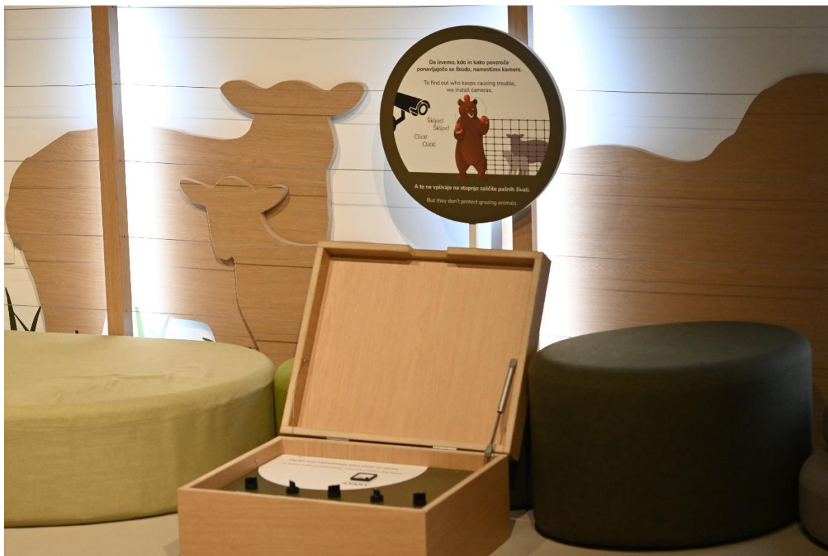
Novo nadgrajena postaja Pašnik in visoka elektromreža