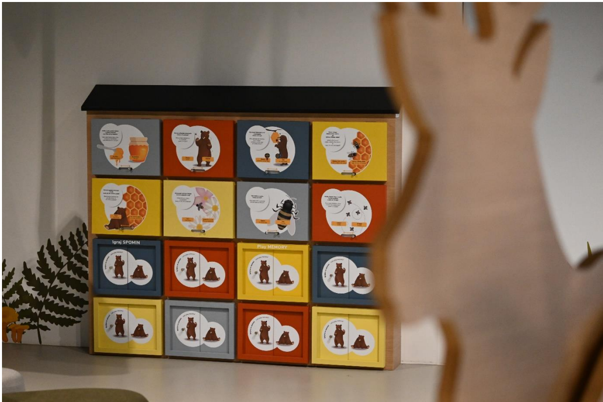
Novo nadgrajena postaja Čebelnjak