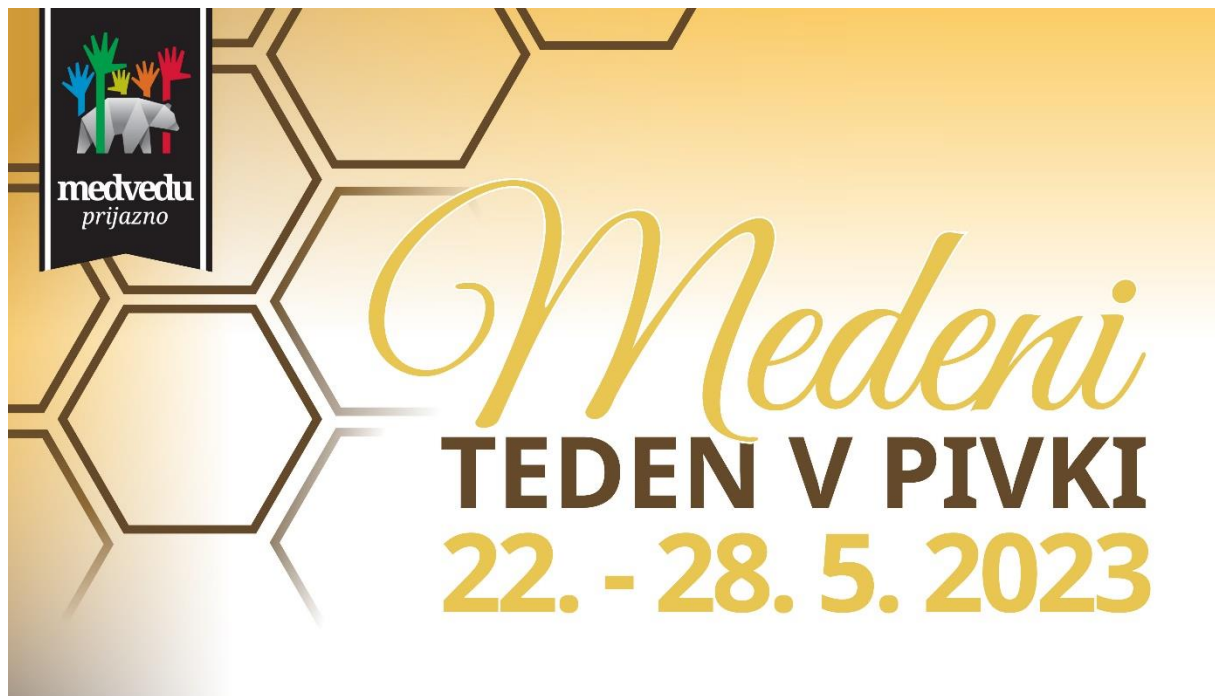
Naslovnica Medeni teden v Pivki